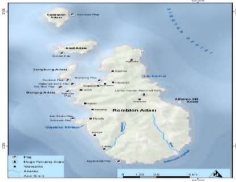
Harita 3: Romblon Adası ve Yakın Çevresinin Lokasyon Haritası

Romblon eyaletindeki adalarda nemli subekvatorial iklim görüldüğünden dolayı her ay sıcaklık ve nem değerleri yüksektir. Bölge kıyılarındaki yıllık deniz sıcaklık ortalamaları 23 ile 28°C arasında, deniz suyu tuzluluk oranları ise binde 32 ile 33 arasında değişmektedir. Adalara düşen yıllık yağış miktarları özel konuma bağlı olarak 2400 ile 3400 milimetre arasında, aylık maksimum ve minimum ortalama sıcaklıklar ise 22 ile 32°C arasında değişmektedir. Sıklıkla tropikal siklonlara maruz kalan adalarda, gel-git genişliği 2 metreyi aşmaktadır. Romblon Adasında en az yağış Ocak-Mart döneminde, en fazla yağış ise Haziran-Aralık döneminde düşmektedir (Tablo 2). Romblon eyaletindeki adalarda deniz turizmi için en uygun dönem Ocak-Mayıs dönemidir, çünkü bu dönemde hem tropikal siklon olasılığı hem de yağış miktarları azalmaktadır. Bu küçük adalarda Temmuz-Kasım döneminde bazen şiddetli tropikal siklonlar ve tayfunlar görüldüğünden dolayı bu dönem deniz turizmi için pek uygun değildir.