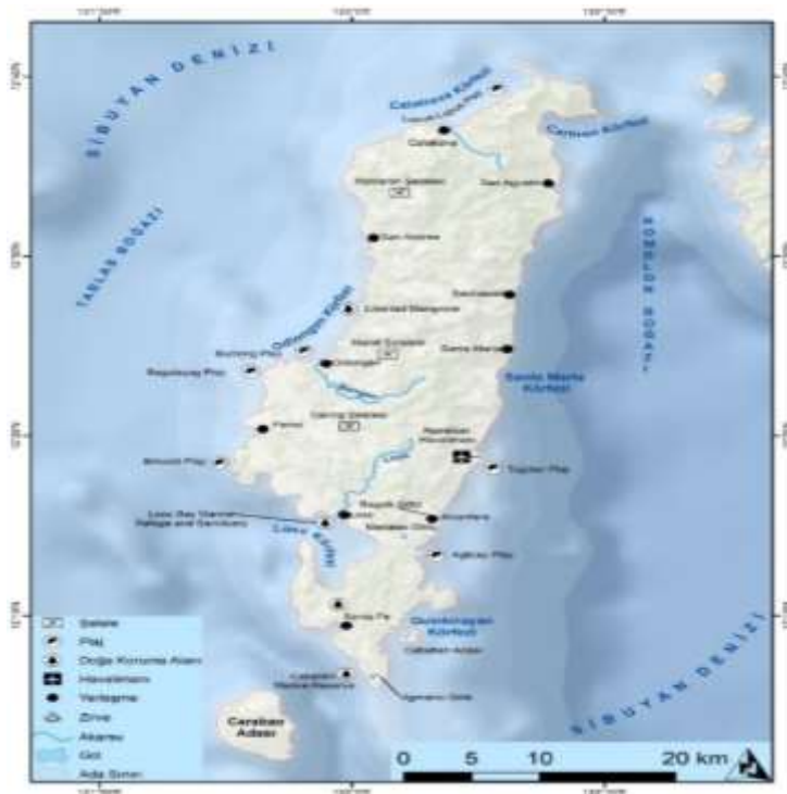
Harita 4: Tablas Adası Lokasyon Haritası

Tablas Adası gürültülü metropol kentlerden ve kalabalık turizm merkezlerinden uzak, seyrek nüfuslu, sakin ve huzurlu bir adadır. Bakir tropikal ormanlar, yüksek şelaleler, ilginç mercan oluşumları, zengin flora ve faunaya sahip doğa koruma bölgeleri, sessiz plajlar ve saklı koylar görmek isteyenler Tablas Adasını ziyaret edebilirler. Adada yüzlerce benzersiz ve güzel doğal oluşum yer almaktadır. Tablas Adasının kıyıları genelde kireçtaşı kayalıkları, mangrov ormanları, güzel plajlarla ve temiz kumsallarla kaplıdır. Adanın kıyıları çok girintili çıkıntılı olduğundan dolayı yarımada ve körfez sayısı da fazladır. Santa Fe, San Roque, Alcantara, Guinbirayan, Tugdan, Bachavan, Santa Maria, Looc, Odiongan, Ferrol, Carmen, San Andres ve Calatrava, Tablas Adasının en büyük körfezleridir. 23