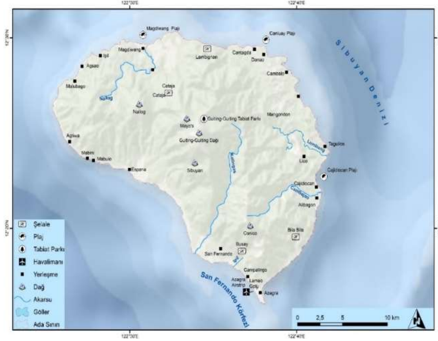
Harita 2: Sibuyan Adası Turizm Haritası

Sibuyan Adasının kuzey kesimlerinde ve Magdiwang kenti yakınlarında yer alan Cataja Şelaleleri, ( Cataja Falls ) ana yollardan uzakta kaldığı için yabancı turistlerin pek ulaşamadıkları ve görmedikleri doğal çekiciliklerin başında gelir. Magdiwang kentinin güneyinde ve Dulangan kasabasının doğusunda yer alan bu şelaleler grubunun en yüksek olanı 18 metreyi bulmaktadır. Kendi içinde irili ufaklı çok sayıda şelaleyi ve doğal havuzu kapsayan Cataja Şelaleleri, bu yöreyi ziyaret eden dağcılarının sıklıkla dinlendikleri yerlerin başında gelir. Magdiwang kentinin doğusunda ve Silum kasabasının batısında daha küçük ama daha kolay ulaşılabilir bir şelale daha vardır: Lambingan Şelalesi ( Lambingan Falls ). 13 Yerel yetkililere 50 pezo ödedikten sonra bu şelale alanını her turist ziyaret edebilir.